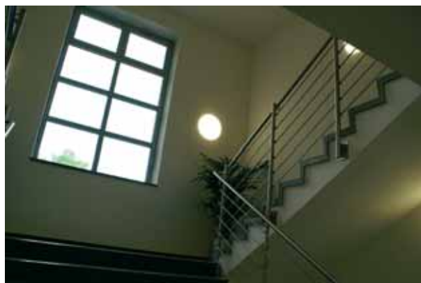
Bild. Flur der Personalabteilung